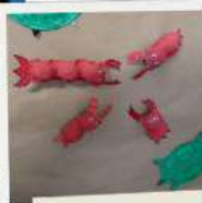
Les animaux marins