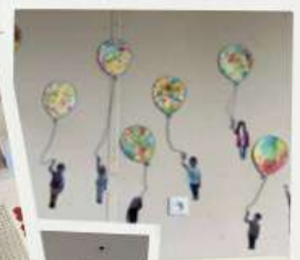
Le Vivre- ensemble