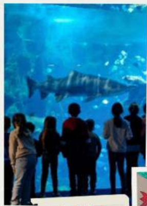
Sorties Escape Game et Aquarium